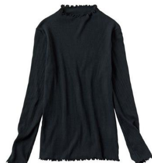
綿ウール ボトルネック 10分袖 税抜価格：1,790円

本商品は、ウールのまわりを綿でカバーして紡績した糸を使用しており、綿90%なので肌に優しく、ウールが10%入っているので真冬でも頼りになるあたたかさがあるインナーです。デザインはシンプルで使いやすく、伸縮性のあるリブ仕様のため、アウターを重ねたときの着心地の窮屈感も軽減します。本シリーズでは、シャツのインに合わせやすい“Vネックの5分袖”、チラ見えの心配がなく、どんなアウターにも合わせやすい“ラウンドネック8分袖”、適度に立ち上がった衿元がおしゃれな“ボトルネック10分袖”の3種類をラインナップしています。