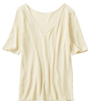
綿ウール Vネック 5分袖 税抜価格：1,590円