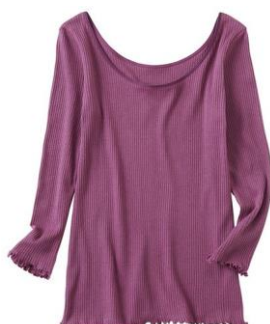
綿ウール ラウンドネック 8分袖 税抜価格：1,590円