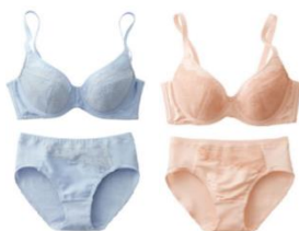
フルカップブラジャー (Tシャツみたいなブラ®)