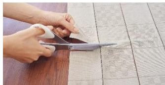
マスキに沿ってカットが可能

花粉分解と菌やニオイをブロックできる抗菌・消臭加工を施した、アコーディオンタイプののれん。廊下や玄関などの仕切りのない出入り口に設置することで、花粉が居住空間へ侵入するのを防ぎます。さらに遮熱効果で部屋の冷暖房効率向上にも貢献。使わないときは、アコーディオンのように畳め、邪魔になりません。