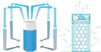
筒型で、360°から強力吸引&amp;消臭