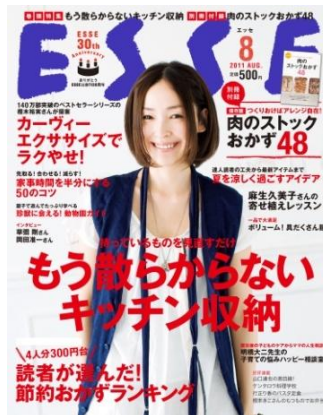
ESSE 2011年8月号 (7月7日発売 定価500円)

『ESSE (エッセ)』は株式会社フジテレビジョン発行、株式会社扶桑社より毎月7日に発売の生活情報誌です。 http://www.esse-web.net/