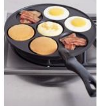
パンケーキパン/5,880 円(税込) http://www.dinos.co.jp/p/1110410755/