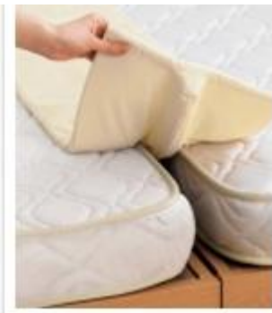
継ぎ目をなくす「すきまパッド」/3,500 円(税込) http://www.dinos.co.jp/p/1117300623/