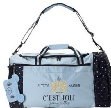
ボンポネットジュニア プレッピー×ポッププリントボストンバッグ 13,340円(税込) http://www.dinos.co.jp/p/1354800034/