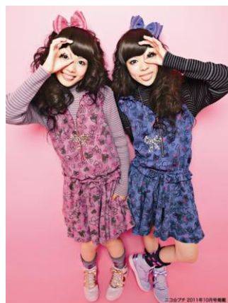
メゾピアノジュニア フロントリボンラメシューレーススニーカー 10,080円(税込) http://www.dinos.co.jp/p/1354800069/