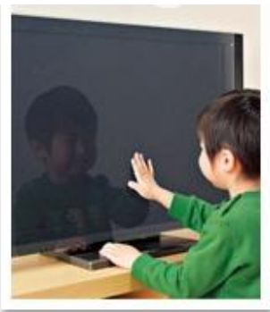
薄型 TV 保護パネル 4,800 円～18,800 円(税込) http://www.dinos.co.jp/p/1110413115/