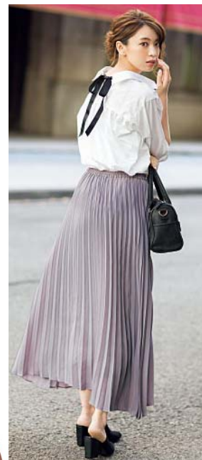
フリッツロングスカート