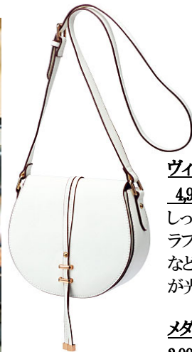
ヴィンテージデザインショルダー