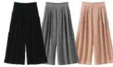
ドレープスカーチョ