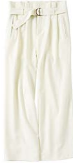
←ハイウエストベルト 付きタックパンツ 4,990 円 ウエストマークが特 徴的な春夏のスタ イリングにおすすめの ワイドパンツ。