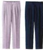
とろみアングルワイドパンツ