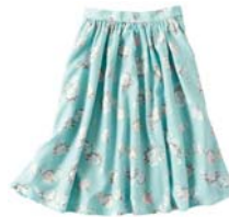
フラワープリント スカート 税抜価格 4,990円