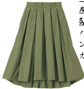
←フィッシュテー ルスカート 5,990 円 ハリ感のある、トレ ンドのミモレ丈のス カート。