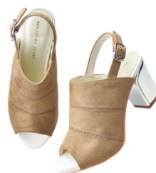
切り替えオープントゥサボ 4,990円

華奢な編み上げベルト&ポイントトゥが美しい足元を演出。後ろファスナー付きで着脱も簡単。