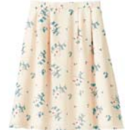
フラワープリント タックフレアスカート 税抜価格 4,990円