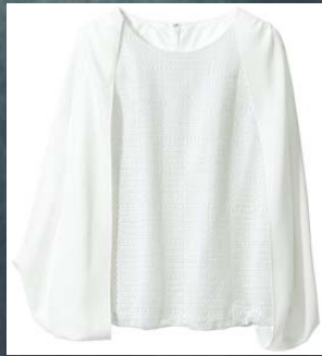
レース切り替えケープ