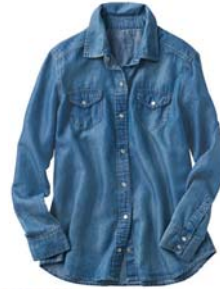
←ライトデニムシャツ 3,990 円 カジュアルにもきれい目 にも使える万能シャツ。