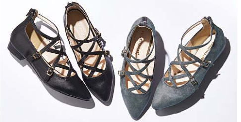
多重ベルトパンプス 2,990円

華奢な編み上げベルト&ポイントトゥが美しい足元を演出。後ろファスナー付きで着脱も簡単。