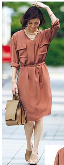
細ベルト付きシャツ

ケープをのせたようなデザインとバルーンシルエットが個性的なブラウス。前身頃は幾何学柄のレースで、後ろ中心スリット入り。