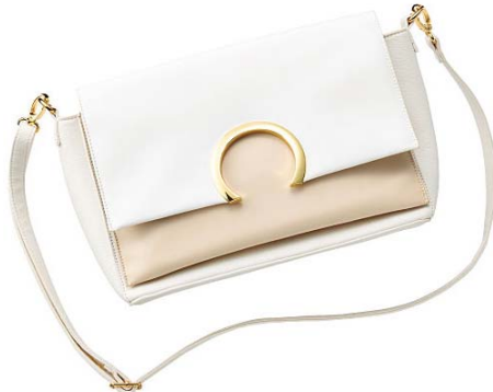
サークルモチーフショルダーバッグ 5,990円

存在感あるサークルモチーフに、ニュアンスカラーがおしゃれなバッグ。多ポケットで収納力もあり、ショルダーを取り外して使うことも可能。