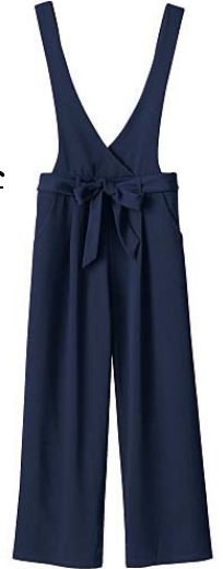
リボン付き V ネックサロペット 5,990 円→ ワイドシルエットが今年らしいきれいめサロペット。