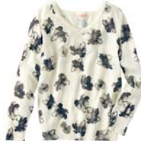
フラワープリント ニット 税抜価格 3,990円