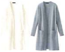
トッパーロングカーディガン