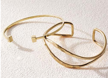
メタルバングル 1,800円

程よいボリュームのバングルを2種類ラインナップ。プレスレットや時計との重ねづけにも!