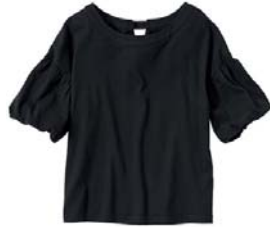
←バルーンスリーブ カットソー 4,590 円 ドロップショルダーの袖 口がバルーンになった デザインカットソー。