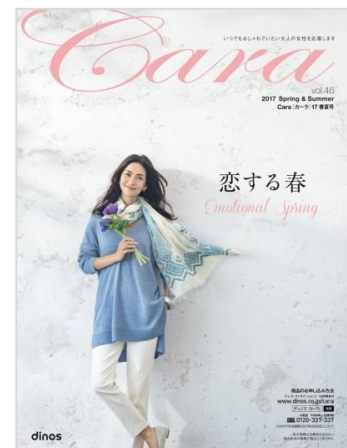
カーラ 2017春夏号 表紙

このほかにも、フレンチマリンの風を感じる、レディな装いの「シネマチックな春」スタイルや、クールに決めすぎず、女らしさが新しいモノトーンスタイルなど、最新ファッションアイテムを幅広く提案します。