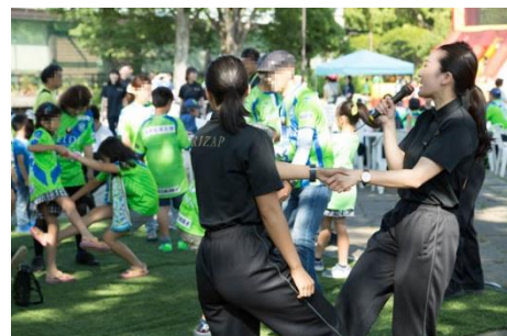
親子で RIZAP ベアトレーニング体験。 200 名以上の親子にご参加いただきました。