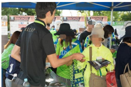
RIZAP スタッフが会場受付にも。ウェルカムコミュニケーションをさせていただきました。