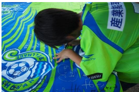
チームへのメッセージや自らのコミットを書き込んでいただく「サポーターズコミットフラッグ」企画。