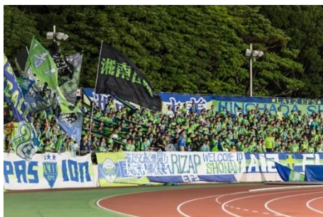
ベルマーレサポーターから「RIZAP WELCOME TO SHONAN」と書かれた垂れ幕が出現！