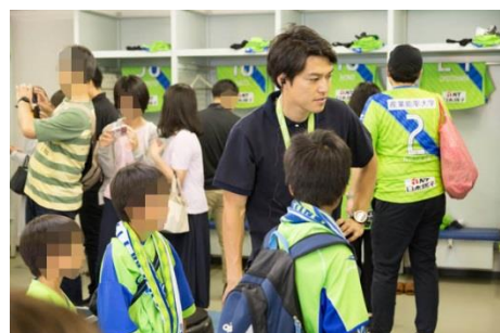
RIZAP グループのスポーツ用品店 B&D 大船店・本厚木店のお客様をお招きしてスタジアム見学ツアー！