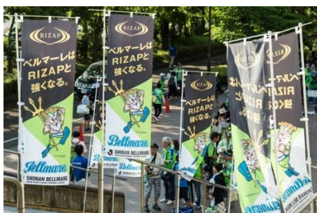
RIZAP スペシャルデーのテーマ「ベルマーレは RIZAP と強くなる。」のぼりでお出迎え。