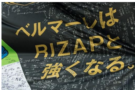
コミットフラッグには、チームや RIZAP への応援メッセージなども多く寄せられました。