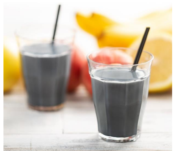
スキのないカラダを目指す「ダイエットフォーミュラ」