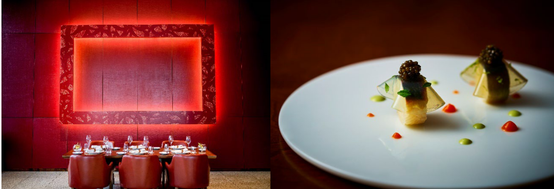
左：Pierre 内観、右：お料理イメージ

インターコンチネンタルホテル大阪のスペシャリティレストラン ピエールが、この度2016年より10年連続でミシュランガイド京都・大阪掲載されました。