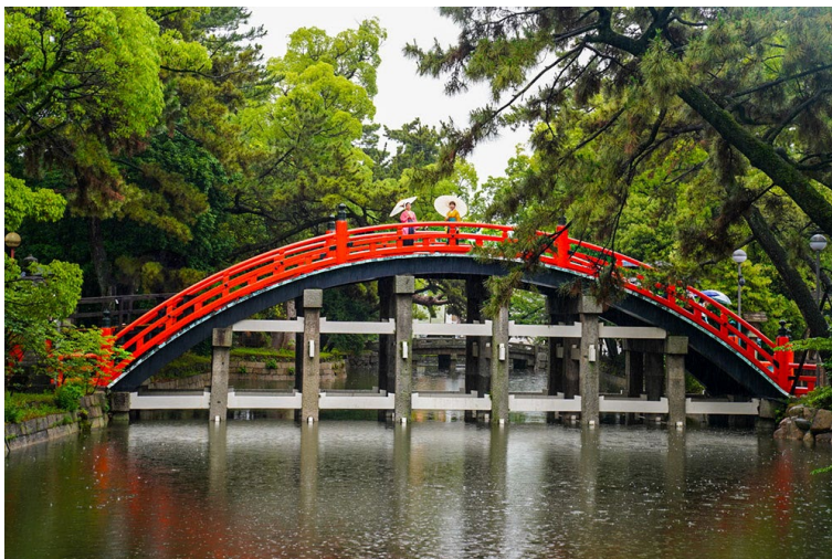
住吉大社ツアーイメージ

ご宿泊されるお客様に特別なローカル体験を提供する「INSIDER PARTNERSHIPS」を、インターコンチネンタルホテル大阪のコンシェルジュチームが企画・提供するプログラム第5弾が登場。