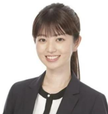
テレビ東京 中根舞美アナウンサー