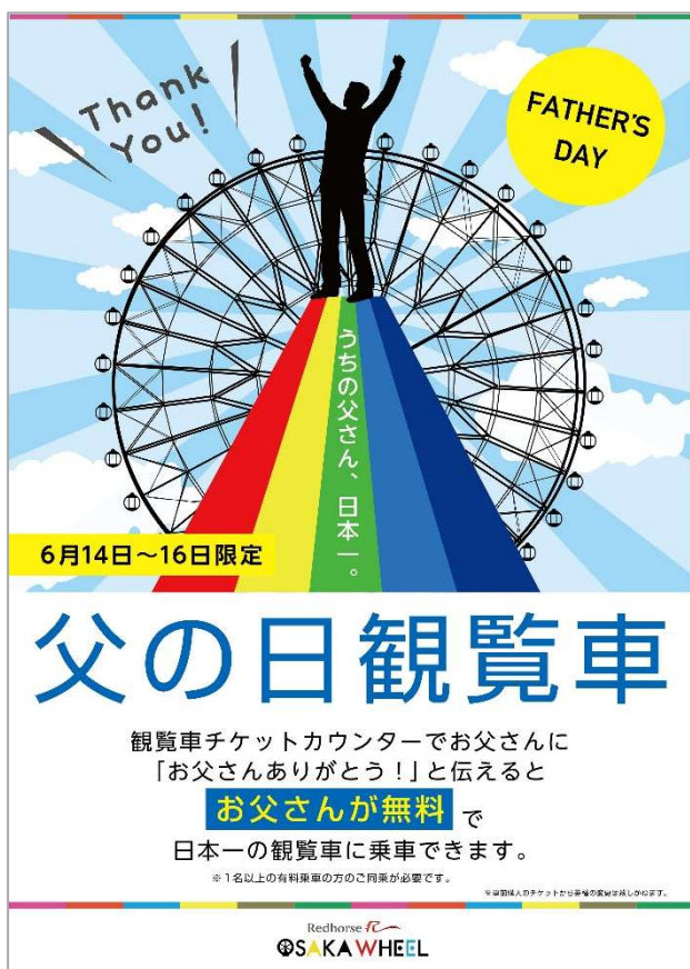
父の日観覧車ポスタービジュアル

今年の父の日は、お父さんに「ありがとう」の言葉と、お父さんと一緒に家族で大阪の絶景を見渡す約 18 分間の時間をプレゼントしませんか？