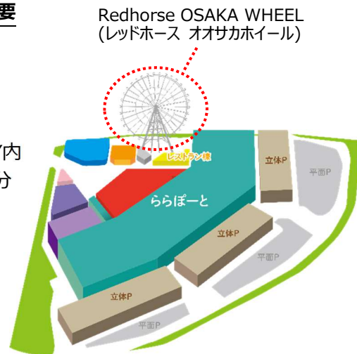
【EXPOCITY 内の観覧車配置図】

名 称： Redhorse OSAKA WHEEL (レッドホース オオサカホイール) 開 業 日： 2016年7月1日 住 所： 大阪府吹田市千里万博公園2-1 EXPOCITY内 交 通： 大阪モノレール「万博記念公園駅」徒歩約2分 営 業 時 間： 10:00～23:00(最終入場 22:40) 定 休 日： EXPOCITY に準ずる U R L： http://osaka-wheel.com 料 金： ・ 通常チケット 1,000円(税込) / 1名 ※3歳以下の方は無料です。