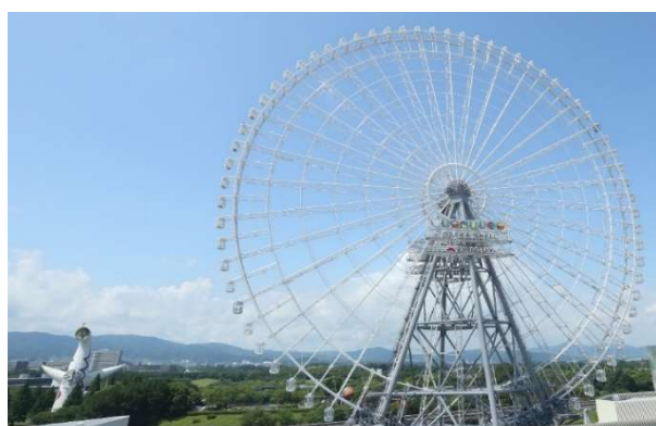
Redhorse OSAKA WHEEL 全景