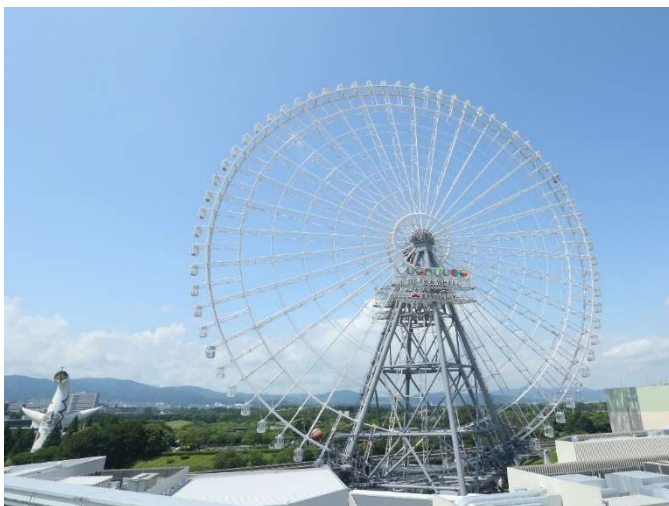
レッドホース オオサカホイール全景

「恋人の聖地サテライト」は一般企業・団体が運営管理をする、プロポーズの場所にもふさわしく、恋人たちがもっとしあわせになれるデートスポットの中から認定されます。観光庁等が後援となり、それぞれの地域における独自イベント等の開催を通して、地域の活性化ならびに少子化対策に貢献しています。