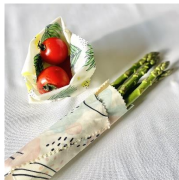
ミツロウ(蜜蝋)ラップ ／ヴィーガンラップ