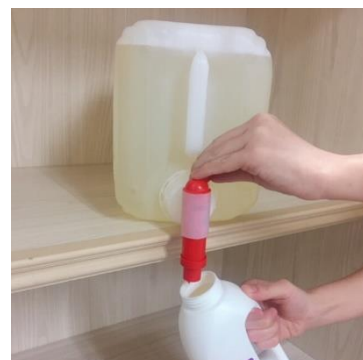
バルク売りコンテナ用 ポンプ