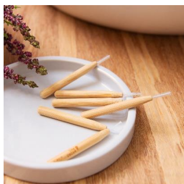
竹製デンタルスティック