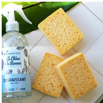
スポンジ(セルロース素材)