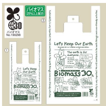
バイオマスレジ袋