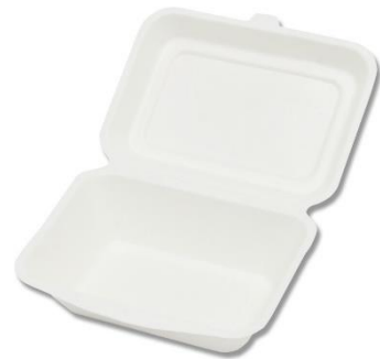
バガスフードパック