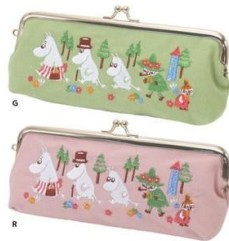
1位：ブライエンタープライズ