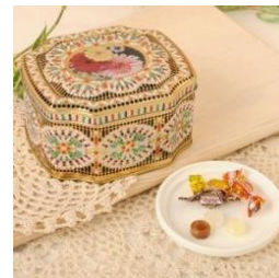
1位：東京タカラフーズ