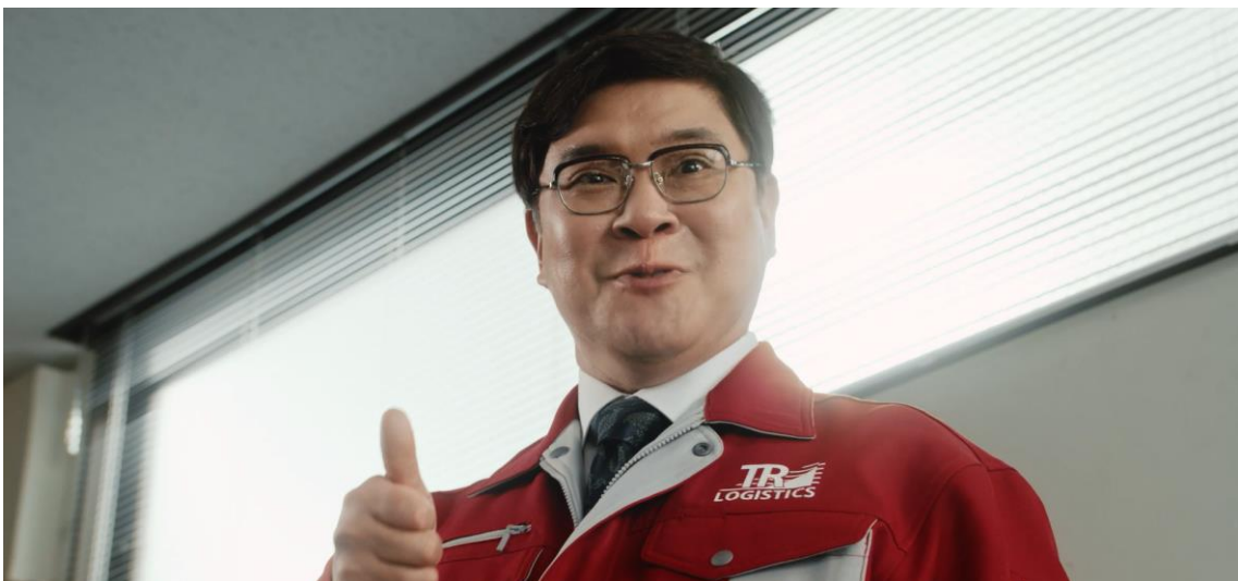
そこで社長がひとこと。「URIHOがあるから大丈夫！」