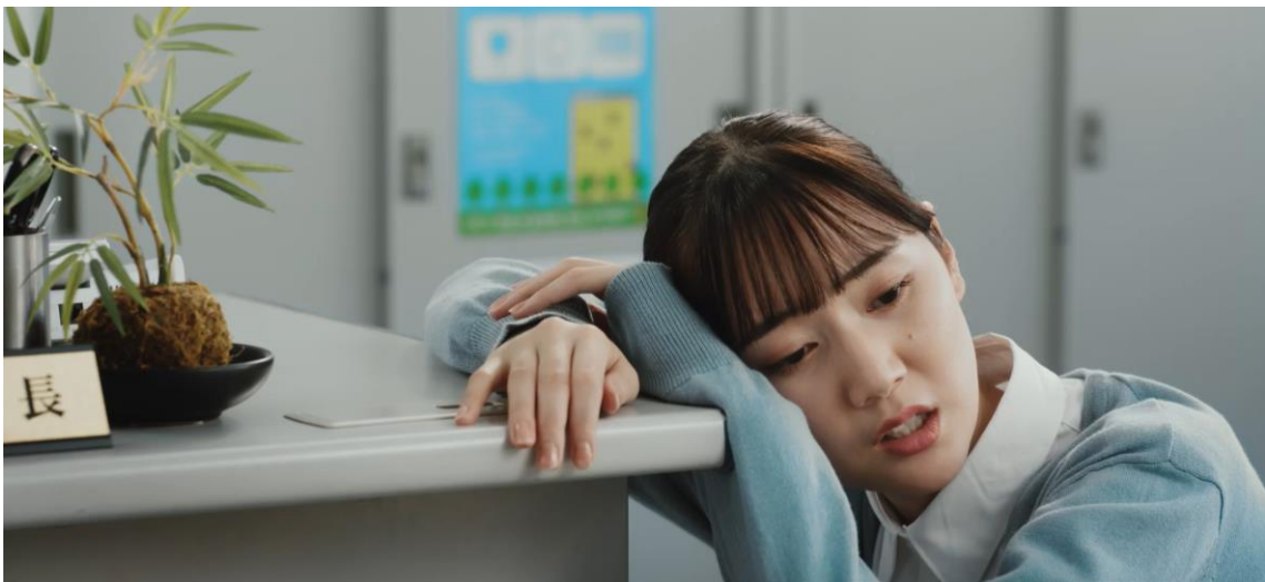
終始落ち着いた対応で電話を切った社長に社員は「何その余裕・・・」と絶望。