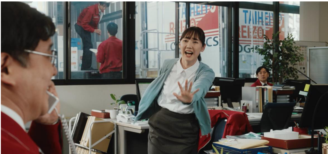
「こちらは一旦大丈夫ですので」と、のん気な社長の様子により社員は大慌て。