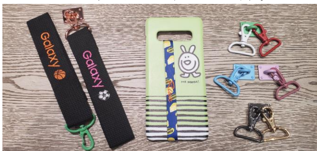
刺繍入りモバイルストラップ、 オリジナルハイループストラップ、 オリジナルストラップ(カラビナ付き)、