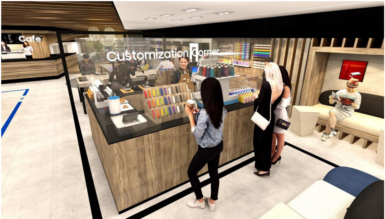
<My Galaxy 完成イメージ>

モバイル製品の世界的リーディングブランドである Galaxy は、当社ブランドの世界観を一度に体験できる、Galaxy 世界最大級のショーケース「Galaxy Harajuku」(ギャラクシーハラジुक)にて、世界にたった一つのスマホアクセサリが作れる、アクセサリカスタムサービス“My Galaxy”を2020年3月18日(水)よりオープンいたします。