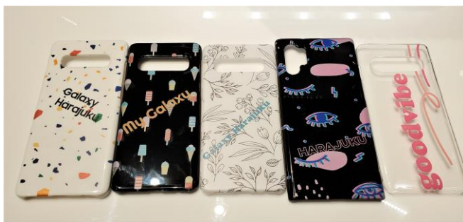
Galaxy オリジナルケース