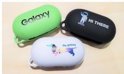
Galaxy Buds オリジナルカバー