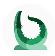
Alligator on the Hunt