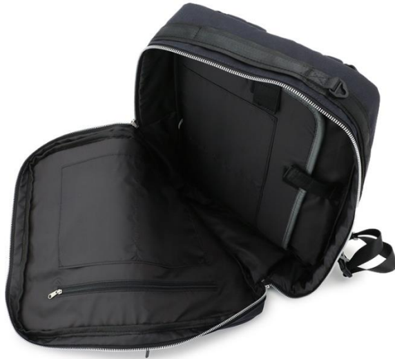
タブレットやノートPCも入るクッションポケット付き