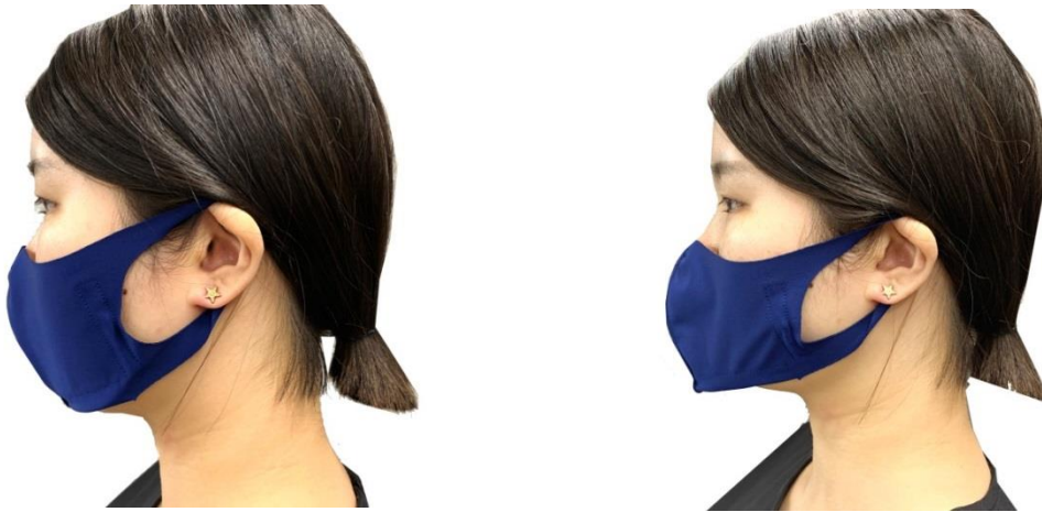
←顎下密着画像 顎下ワイヤー調整画像→