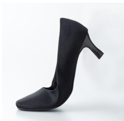
上：ニットによるストレッチ