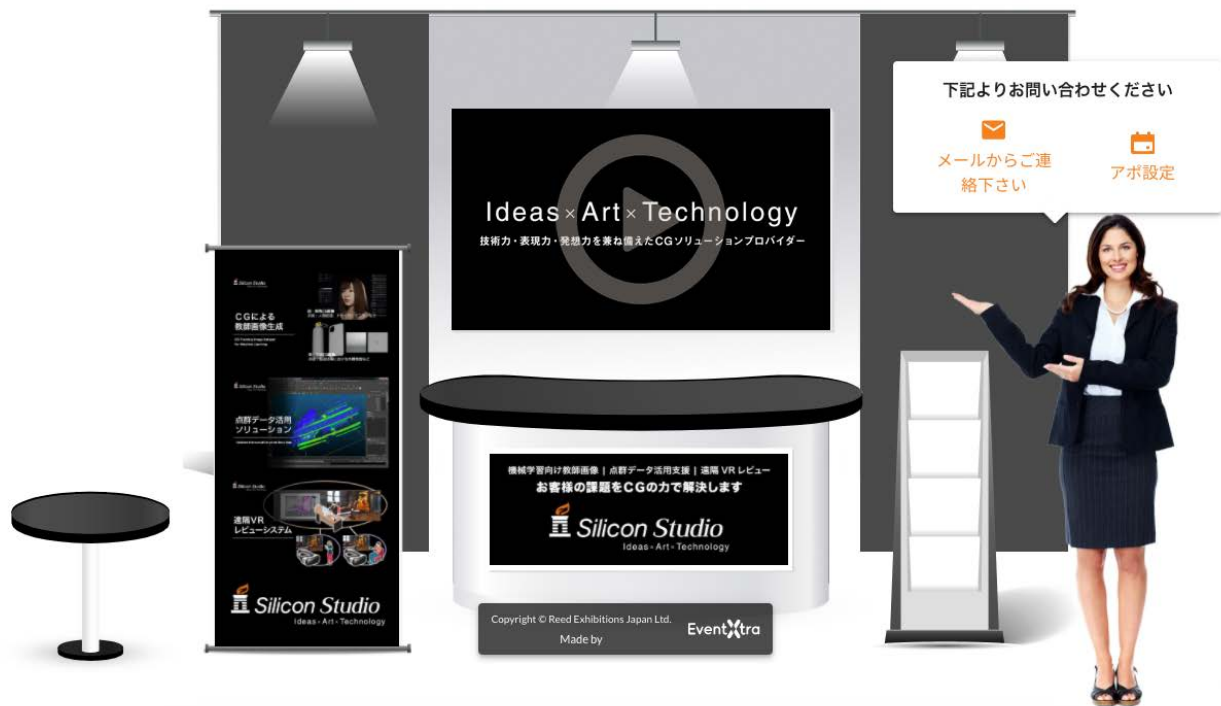
オンライン上のバーチャルブース