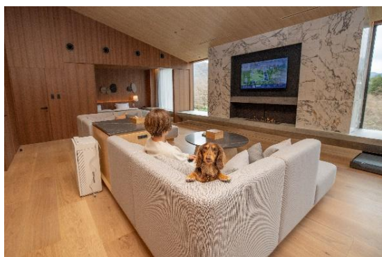
一棟まるごと貸切の「ヴィラ・スイート」

株式会社小田急リゾート（本社：神奈川県小田原市 社長：原 眞示）は、2025 年 12 月 15 日(月)に箱根・桃源台にドッグフレンドリーホテル“ RETONA HAKONE (リトナ箱根) ”を開業します。当ホテルは、2024 年 3 月末に閉業した“小田急 箱根レイクホテル”から全面リノベーションし、今冬に新装オープン。「 RETURN TO NATURE （自然への回帰）」をコンセプトに、全 15 室の客室はすべて温泉付きで、屋内外の多彩なドッグランやグルーミングルームなど充実した施設を備え、愛犬と共にゆったりとしたひとときを楽しめます。