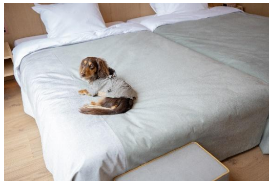
愛犬用の館内着（イメージ）

快適にお過ごしいただくために日用品をはじめ愛犬用のベッドやトイレはもちろん、一緒に眠る時に愛犬がベッドに乗るための「ベッドステップ」、館内の移動に便利な「ペットカート」などのご用意もあります。ご家族と同じ生地を使った愛犬用の館内着もサイズ別に用意し、お揃いの館内着を着てお過ごしいただけます。