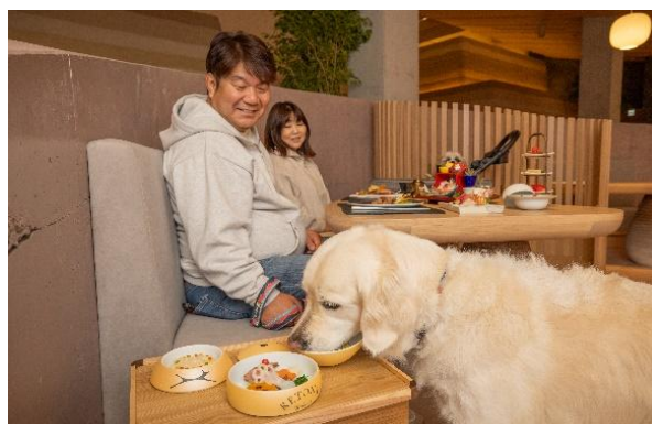
愛犬との夕食（イメージ）