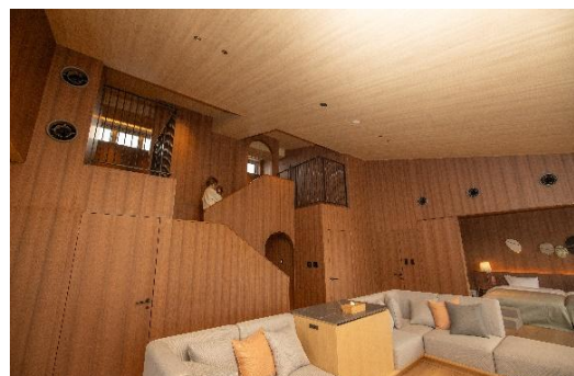
ヴィラ・スイート