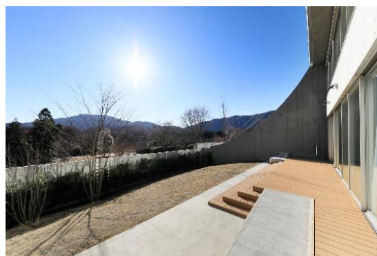
1 階の一部客室には、専用のドッグランを完備

「愛犬と一緒にいける場所をもっと増やしたい」「特別な旅行体験をしたい」という愛犬家の需要が高まる中、当社には、かねてより箱根におけるドッグツーリズムの先駆けとして、愛犬連れガストロノミーを追求する“小田急 箱根ハイランドホテル”（2025 年 12 月現在休業中）で積み重ねてきたノウハウがあります。そこで、これまでに培われた食とおもてなしのサービス精神をさらに深化させ、ホテル館内すべてにおいて愛犬と気兼ねなく過ごせるハイエンドな愛犬特化型ホテルとして、愛犬ファーストなサービスをご提供してまいります。