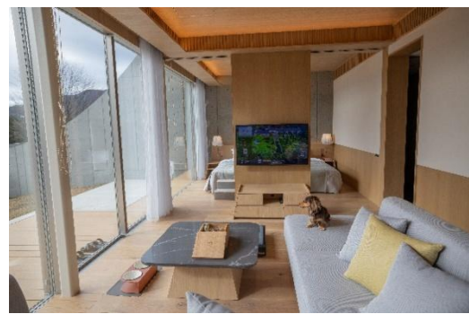
ウッドデッキとプライベートドッグランを併設 ラグジュアリー-A-Type