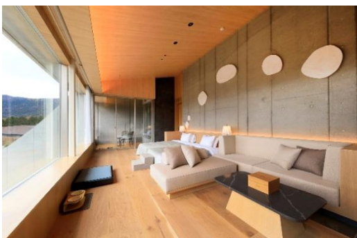
インナーバルコニーのあるデラックスタイプ