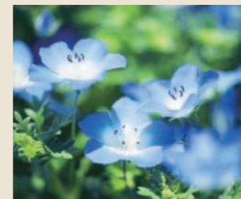
ネモフィラ 5月上旬～下旬