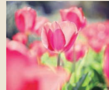
チューリップ 3月下旬～4月下旬