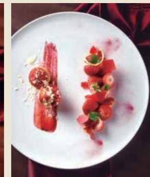
季節のクリエイション ¥1,830