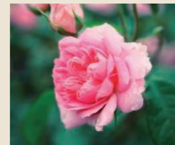
ローズ 5月中旬～6月下旬