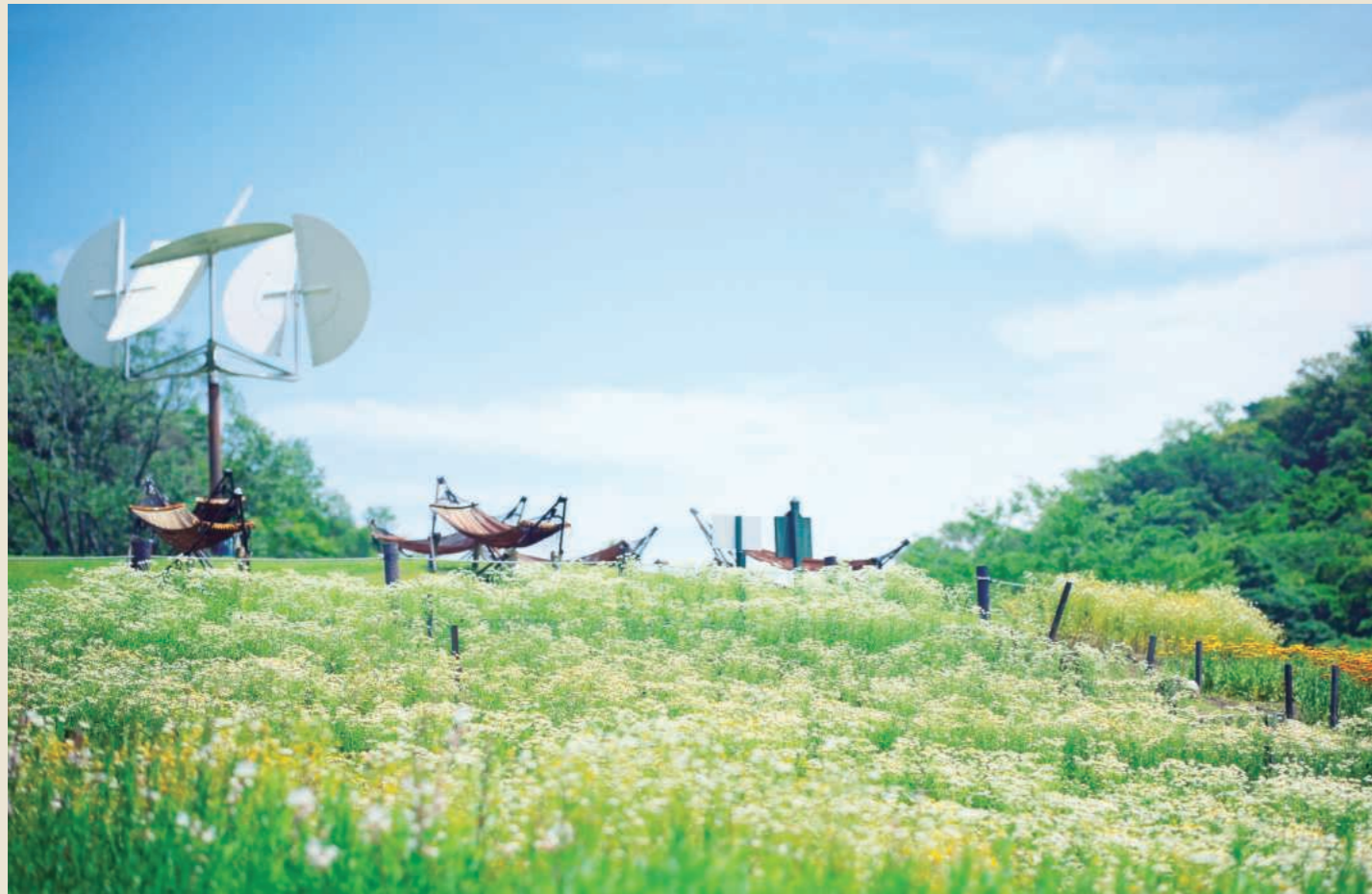
風の丘フラワー園 カモミール 5月上旬～6月上旬