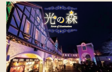
NIGHT VIEW キラキラの思い出づくり

園内各所に設置されているハンモック。ゆったりと身体を預けて、心地よい風を感じながらお寛ぎください