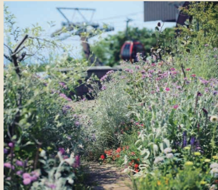
ウェルカムガーデン