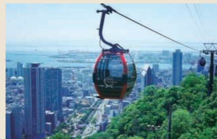
ROPEWAY 約10分間の空中散歩

新しい季節の訪れに合わせ、自らが主役とばかりにハーブや花たちが華やかに咲き集います 生命の息吹を感じる新緑の森、四季彩あふれるガーデンでたっぷり春をお楽しみください