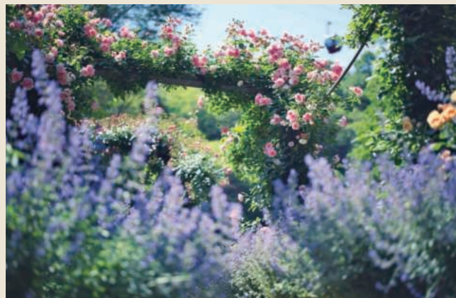
ローズ 5月中旬~6月下旬 ラベンダー 5月下旬~7月上旬