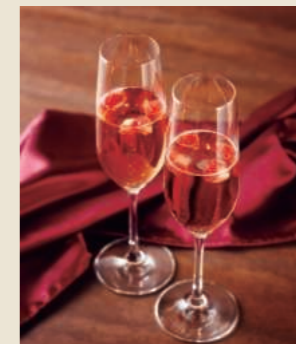
苺入りスパークリングロゼ ¥950～