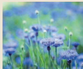
コーンフラワー 4月下旬～6月上旬