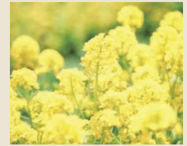
ハナナ 3月中旬～4月中旬