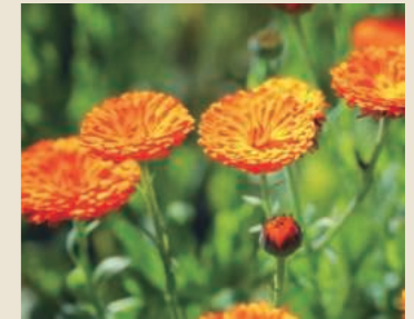
ポットマリーゴールド 4月下旬～6月上旬