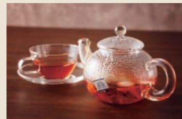
あまおう苺のブレンドハーブティー ¥1,230

オリジナルのハンバーガーやスイーツ、ハーブティー、ソフトクリームなどをお手軽にお楽しみいただけます。