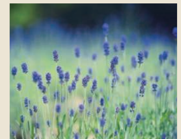
ラベンダー 5月下旬～7月上旬