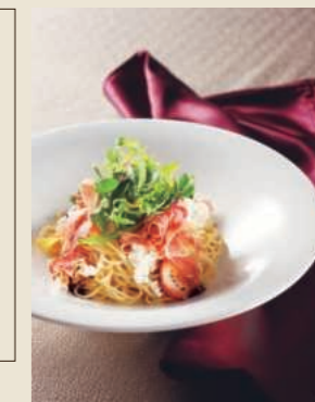
苺とリコッタチーズとプロシュートの冷たいパスタ

※お子様メニューは別途ご用意しております (アイスクリーム付き ¥1,210) ※お子様メニューには前菜は付いておりません