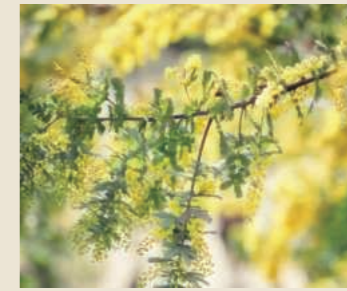
ミモザ 3月中旬～下旬