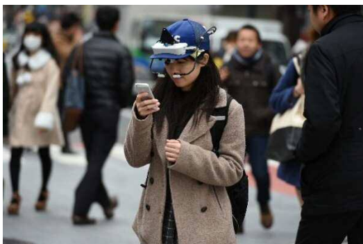
歩行者編の「ながらスマホ」検証

http://www.jaf.or.jp/eco-safety/safety/usertest/smt/index.htm