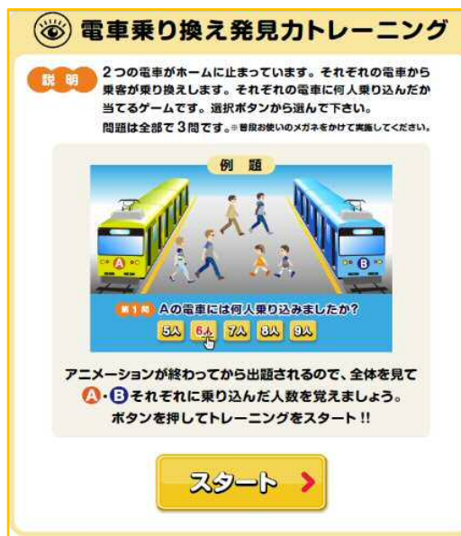
チェック・トレーニング 一例