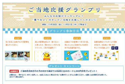
あなたの「食べたい！」が1位を決める！ ご当地応援グランプリ

また、特設ページ公開にあわせて、閲覧者の投票により決まる「ご当地応援グランプリ」を開催します。「食べたい！」と思った“ご当地グルメ”に投票することで、人気ランキングがリアルタイムで更新。ナンバーワンの“ご当地グルメ”を決定します。投票された方の中から抽選で10名様にQUOカード（1,000円分）をプレゼントするキャンペーンも実施しています。（JAF 会員限定/投票は1月31日正午まで）