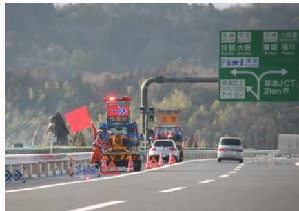
本線上での停車は危険！JAFでは安全のため高速道路での作業時、後方警戒を実施しています。