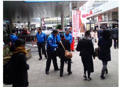
昨年、東京での街頭活動の様子（JR 田町駅前）