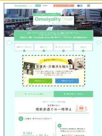
Omoiyalty Drive TOP ページ

Omoiyalty Drive キャンペーン URL : https://omoiyalty.jp/