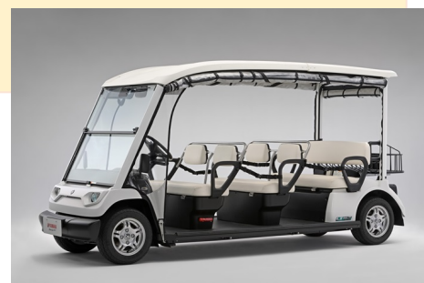
グリーンスローモビリティ車両

会場内の JAF ブースでは、JAF とヤマハ発動機が協業する「グリーンスローモビリティ」の車両展示や、交通安全のクイズに答えてもらえる免許証そっくりなカード「子ども安全免許証」の出展など家族で楽しめるコンテンツも用意。ドライバー・オブ・ザ・イヤーに投票くださった方へのオリジナルグッズプレゼントなどクルマやモータースポーツに親しめるコンテンツを提供します。