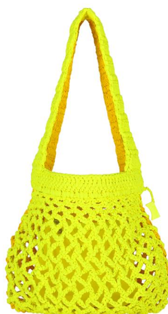
ネオンイエロー×イエロー