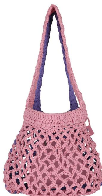
ピンク×ラベンダー