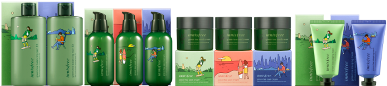
※対象商品イメージ

イニスフリー商品のご購入を通し、お客様に身近なエコ活動にご参加いただける機会となっております。