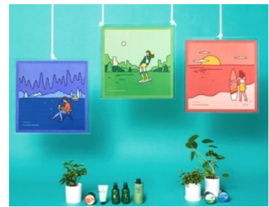
※オリジナルエコハンカチイメージ

販売名:①GT バランシングトナー、②GTS セラム、③GTS クリーム、④GT ナイトマスク