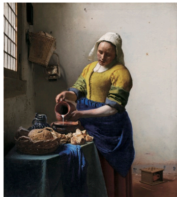
《牛乳を注ぐ女》 1658~60年 アムステルダム国立美術館蔵