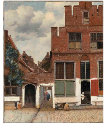
《小路》 1657~58年 アムステルダム国立美術館蔵