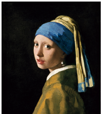
《真珠の耳飾りの少女》 1665年 マウリッツハイス美術館蔵