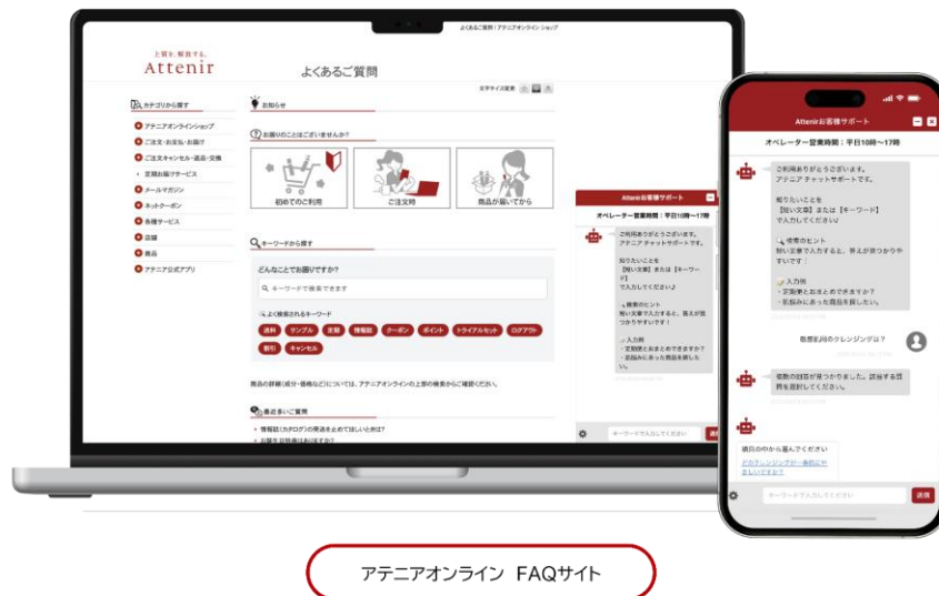
アテニア公式オンラインショップでのチャットボットの問い合わせ画面