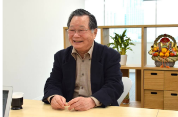
ご紹介した 76 歳男性