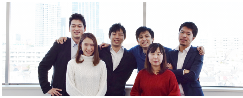
20代中心の若いメンバー