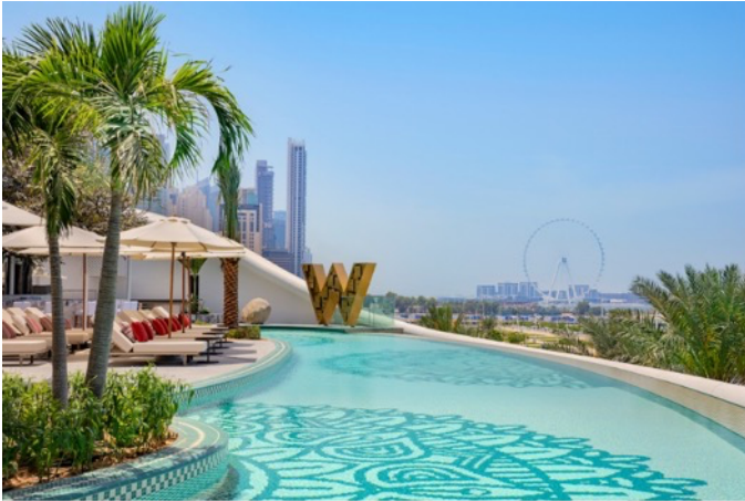
W ドバイ ミナセヤヒ

https://www.marriott.co.jp/hotels/travel/dxbmw-w-dubai-mina-seyahi/