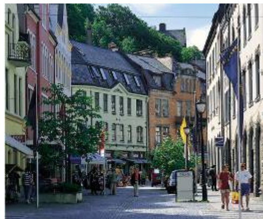
オーレスンの街並み