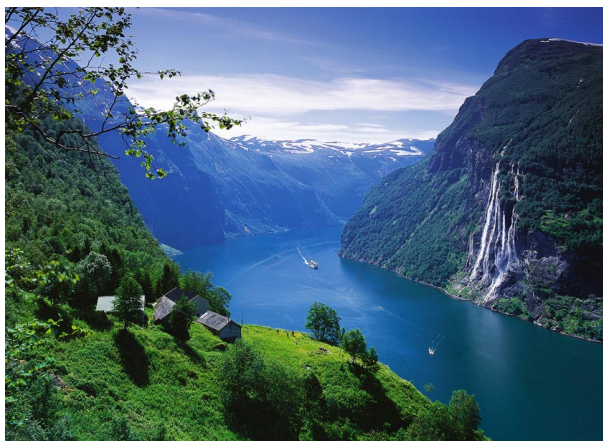
ガイランゲルフィヨルド