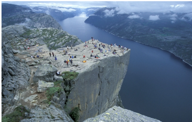
リーセフィヨルドから突き出たプレーケストーレン