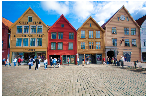
ベルゲンの世界遺産ブリッゲン