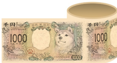
カスタムテープ(養生テープ)