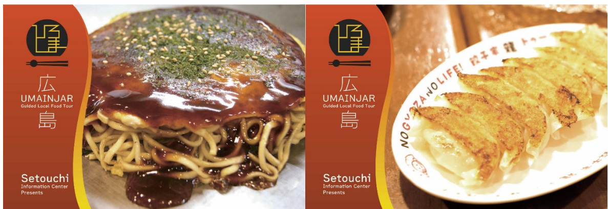
▲UMAINJAR TOUR フライヤー(左:ちんちくりん版 右:餃子家龍版)