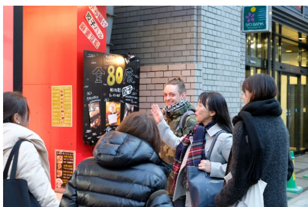
▲ガイドツアーの様子