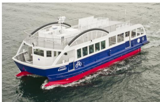
サイクルシップ・ラズリ

サイクリストの聖地と呼ばれるしまなみ海道の海や島とサイクリングロード(ブルーライン)を本船が繋ぐことをイメージして命名しました。