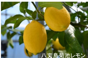
八丈島菊池レモン

担当:黒田雅人・鈴木真理 TEL.03-3470-2573 FAX.03-3470-2557