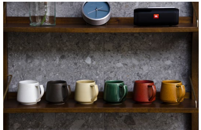
キキマグ全6色展開

イギリスをはじめ世界十数か国で展開しているグローバル調理家電ブランドRussell Hobbsの日本総販売代理店として、当時まだ日本では普及していなかった電気ケトルを2000年より販売をしてみました。また、自社ブランドのCoresは2013年より、コーヒーにこだわる人たちに向けた本格コーヒープロダクトのブランドとして立ち上げ、コーヒーのプロフェッショナルと共に商品開発を行い、コーヒーのプロの方々にも信頼を頂いているブランドに成長してまいりました。