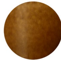
美濃伊賀 (キヤメル)

鉄釉は酸化鉄を呈色剤とした釉薬が使われている焼き物のことで、その含まれる鉄の分量によって黄褐色から黒色まで発色します。瀬戸黒も鉄釉の一種です。