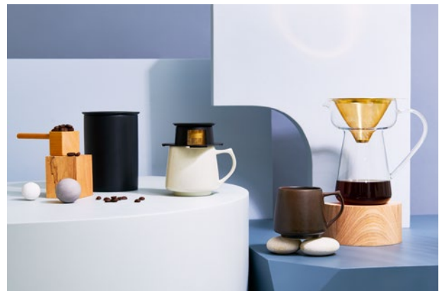
現在発売中のCoresブランド

Coresの原点でもある、純金がコーティングされた「ゴールドフィルター」は主力製品です。現在、「Coresゴールドフィルター」は市場でも独自のポジションを獲得しています。今後の商品展開でもコーヒープロダクトブランドCores独自の商品開発を行ってまいります。