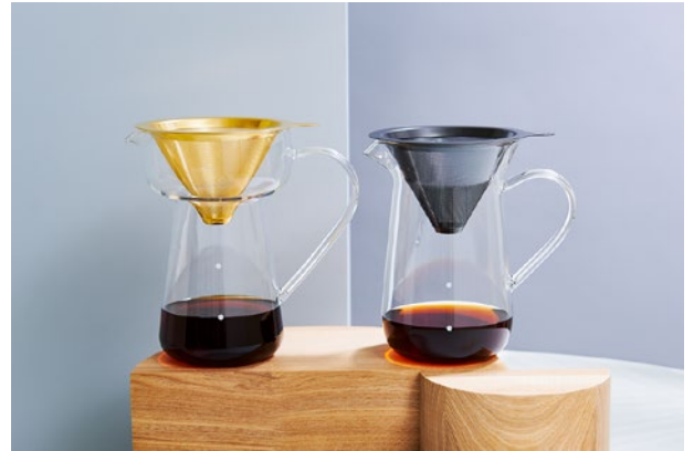
左「ゴールドコーンフィルター＆サーバーC751GD」13,200円(税込)

2021年9月に「ゴールドコーンフィルター＆サーバー C751GD」、11月に「チタンコーンフィルター＆サーバー C761GY」も発売しました。誰でも簡単にフレッシュなコーヒーアロマが楽しめるスペシャルティコーヒーに最適なアイテムです。ワイングラスのようなサーバーの膨らみ部分に蒸気と香りが充満し、ドリップ時に芳醇な香りが立ちのぼります。Cores独自のフィルターは縦長メッシュ形状で目詰まりを起こしにくく、旨みやアロマ成分をそのまま抽出するため、豆本来の香りや味わいをしっかりと感じることができます。