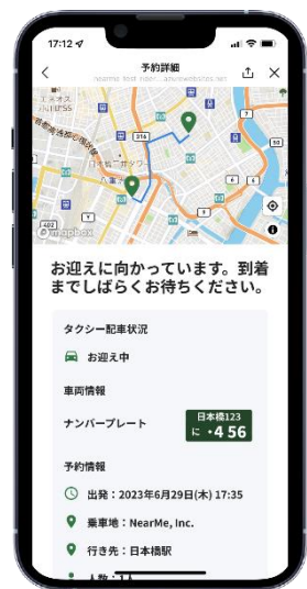
タクシー情報を確認し乗車