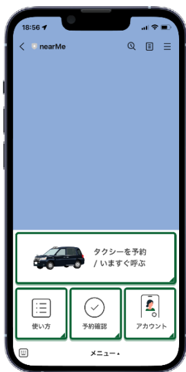
リッチメニューの「配車」をクリック

新たに配車サービスのアプリをダウンロードすることなく、LINEにてタクシー事業者のLINE公式アカウントを友だち追加するだけで、タクシーの配車予約が可能になります。乗車地、行き先、乗車人数、など必要情報を入力し、「今から呼ぶ」「日時指定」のいずれかを選択するだけで手配が完了。さらに手配された車両のナンバーや到着予定時刻、目安の料金が事前に表示されるなど、利便性の向上を可能にします。