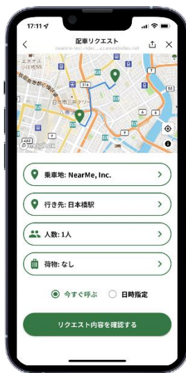
配車依頼に必要な情報を入力