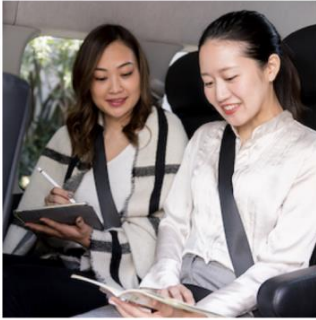
ゆとりの最大9人乗り (スーツケース持込可)