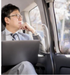
ホテルからお好きな場所まで快適に