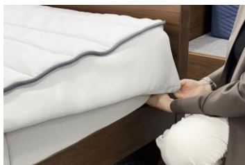
カバー着脱の様子

今回導入したベッドマットレスは表と裏で硬さの異なる3つのパーツをボックスシーツ型のカバーで固定するモデルで、滞在されるお客様に合わせた寝心地を実現します。またカバーは従来モデルに比べ着脱が容易なため、お手入れやベッドメイキングがしやすく、日々の作業負担も軽減できます。