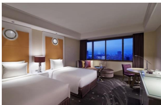
東京マリオットホテル「Pure wellness room with airweave」客室例

「Pure wellness room with airweave」は、19階のフロア全て(12部屋16床)で提供され、“高品質な空気”と“快適な睡眠環境”をコンセプトにした特別な客室です。空気中や床・壁に付着するウイルスなどの粒子を99%取り除く、衛生的でリフレッシュできる室内空間で、エアウィーヴの極上な寝心地をお楽しみください。