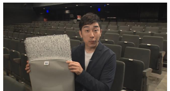
劇場内で放映されたクッション紹介映像

また、劇場内の楽屋には、フローリングや畳に直接敷いてお使いいただける三つ折りタイプのマットレス「スマートZ」を設置。レインボーの2人も、公演の本番前後にご使用いただいています。