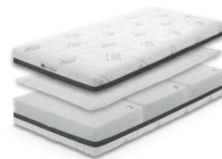
エアウィーヴ ベッドマットレス S04

お二人は現在、東京2020大会の選手村に提供するマットレスと同じ技術を使った「エアウィーヴ ベッドマットレス S04」を愛用しています。体形に合わせて肩・腰・脚の各パーツの硬さをカスタマイズできるので、理想的な寝姿勢を保ちながら、日々のコンディションを整えています。